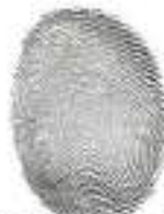
WILMER LENIN VERDUGO GONZALEZ ALCALDE DEL CANTÓN PABLO SEXTO