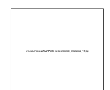
Imagen de referencia Adoquin de concreto de lineas para guía podotáctil