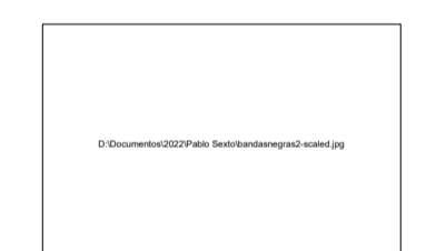
Imagen de referencia Bandas guía autoadhesiva