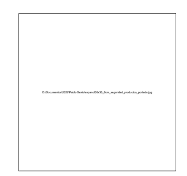
Imagen de referencia Adoquin de concreto de puntos para indicador podotáctil